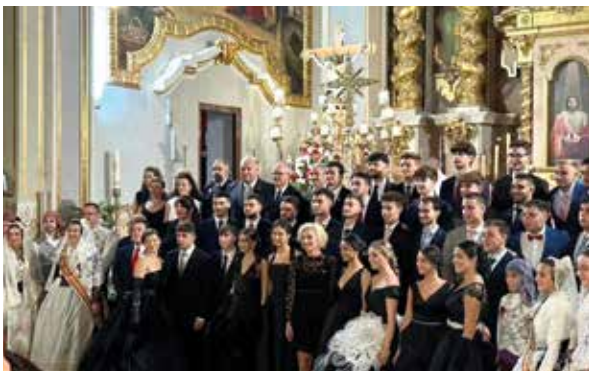
Dia del Crist de la Providència

protagonitzaren activitats que gaudiren tots els públics. Sopars populars, tardeos, concerts, activitats infantils o disfresses, van fer les delícies de tots els assistents.