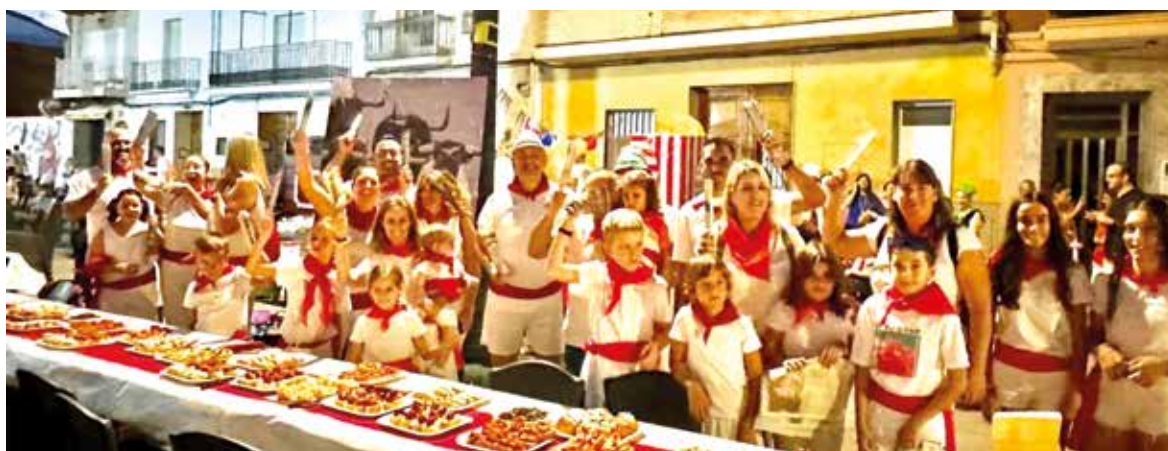
II Concurs de Sopar de Colles de Rafelbunyol