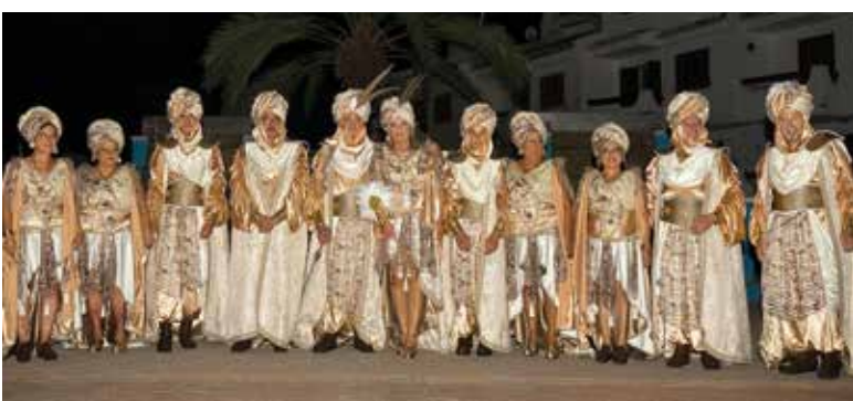
Entrada de Moros y Cristianos. Comparsa: Al-Farnals.