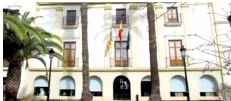
Ayuntamiento de Moncada

Bomberos, guardias civiles, policías locales y voluntarios de protección civil montaron un dispositivo para acceder a las habitaciones del centro de ancianos de Valencia y sacar, uno a uno, a los mayores afectados por el humo en una cadena humana bajo el humo para salvar 38 vidas del incendio.