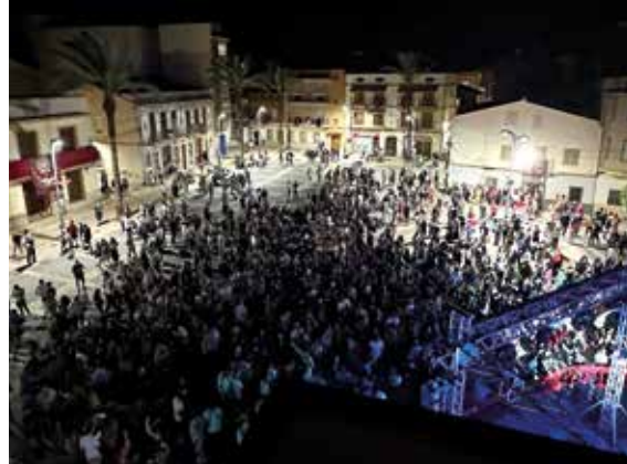
Gran ambiente de una de las noches de orquesta