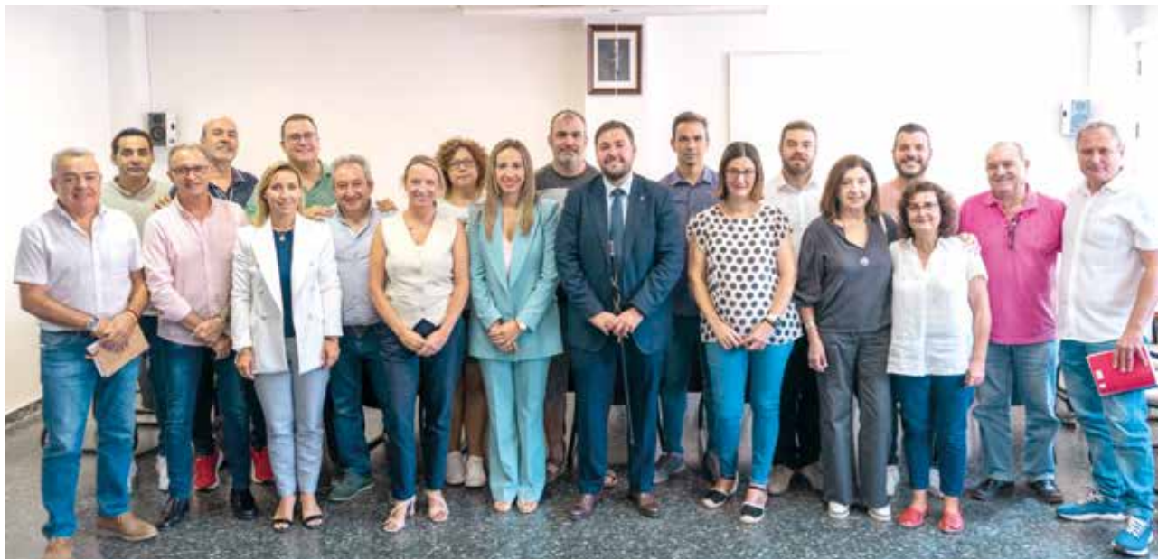
Nueva corporación de la Mancomunitat de l'Horta Nord