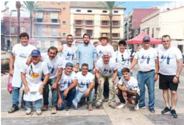
Equipo de Calderas