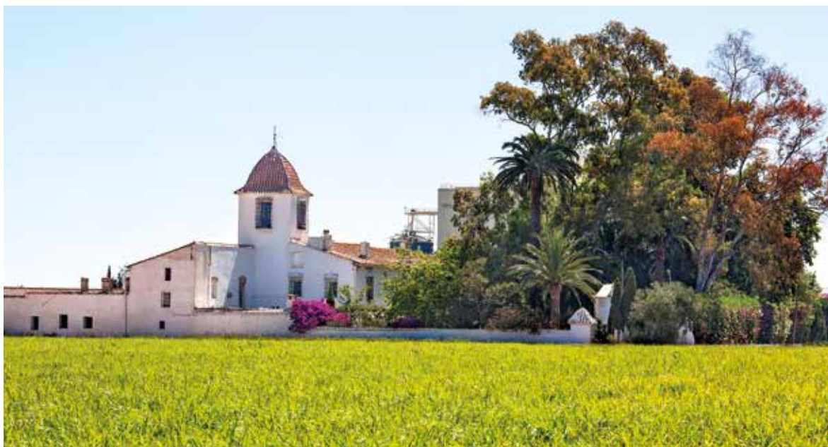
Alboraya. Alquer3a El Machistre

LA RUTA DEL SANTO GRIMAL POR TIERRAS VALENCIANAS CONSTA DE 7 ETAPAS, EN LAS QUE SE COMPLETAN ALGO M3S DE 120 KIL3METROS, TANTO A PIE, EN BICI COMO A CABALLO