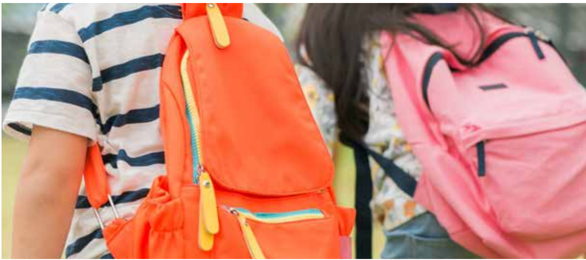
Vuelta al colegio