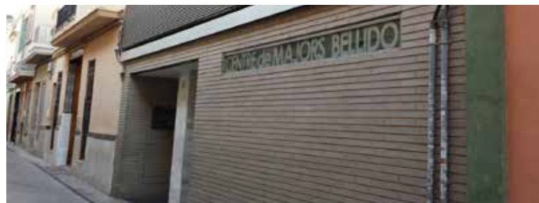
Centro de mayores

La metodología del programa se focaliza principalmente en el desarrollo de actividades preventivas para la pérdida de memoria y la estimulación cognitiva, fomentando la participación activa con el resto de participantes y el ocio grupal para establecer unos patrones de colaboración y diálogo que les permitan alcanzar los objetivos propuestos.