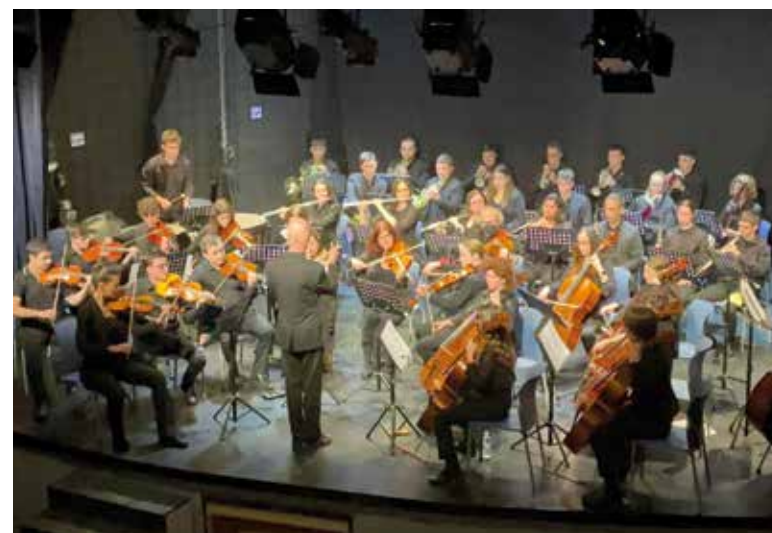
Orquestra Horta Sud