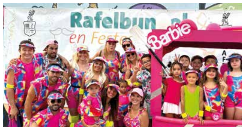
Nit de disfresses