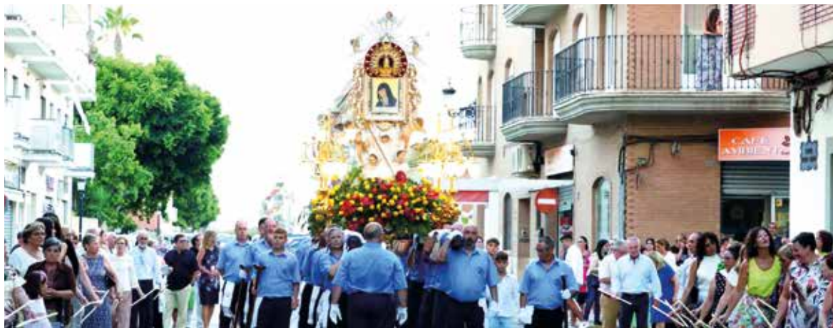
Processó en honor a la Mare de Déu del Miracle del Dia