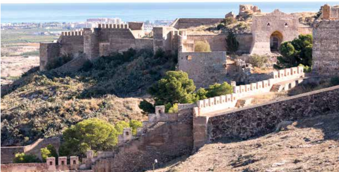
Castillo de Sagunto