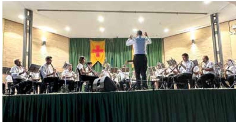
Concierto de la banda de música