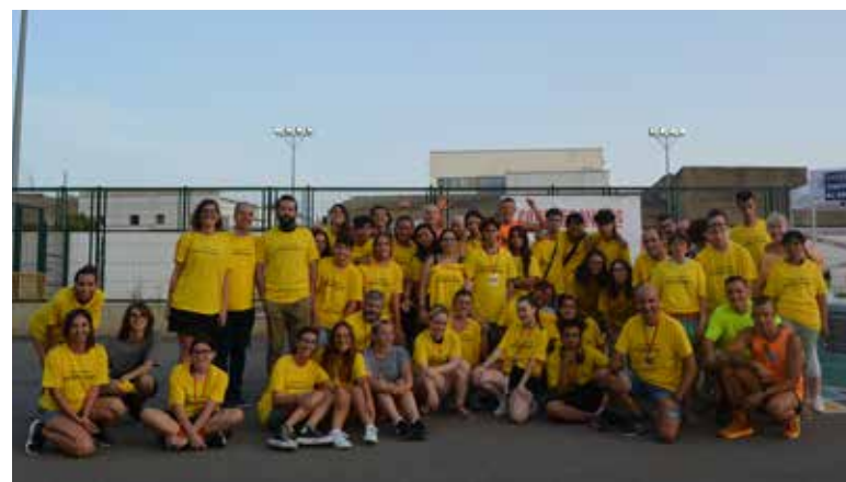
Imatge de grup Apoketanit

Por los hallazgos realizados el área que se conoce pertenecería a la parte privada de la villa. Actualmente el solar de la villa romana es hoy un campo de cultivos de naranjos y sus alrededores una zona industrial donde se han construido algunas fábricas.