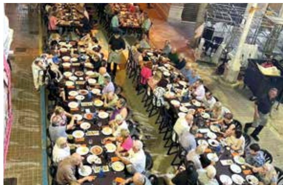
Cena Mayores de Meliana