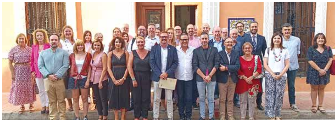
Miembros de la Mancomunitat de l'Horta Sud