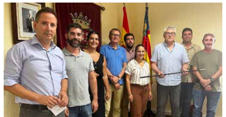
Ple de constitució