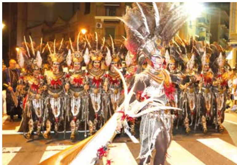
Entrada de la comparsa