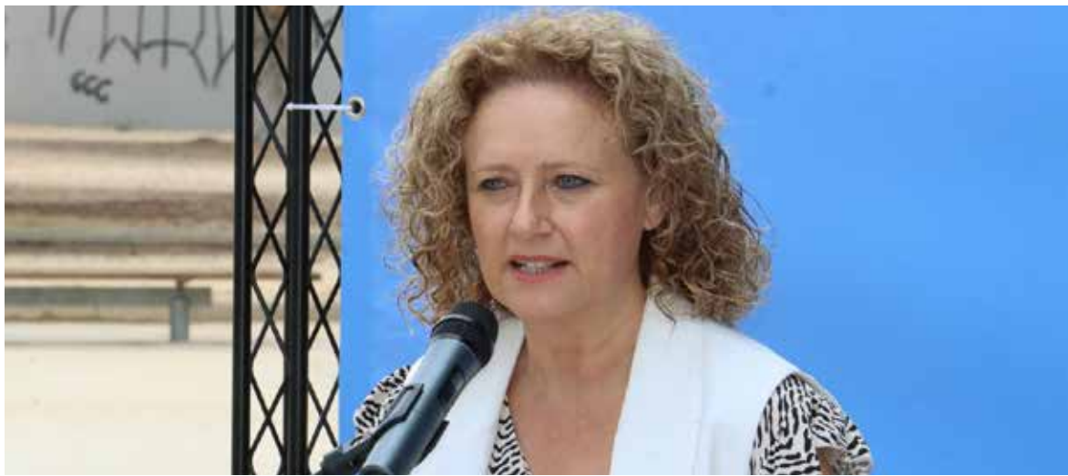
Alcaldesa de Torrent, Amparo Folgado