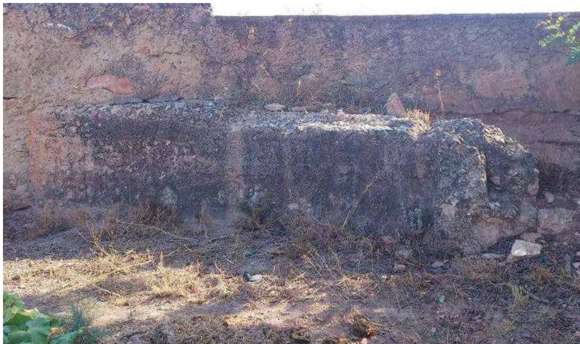
Ereta dels Moros