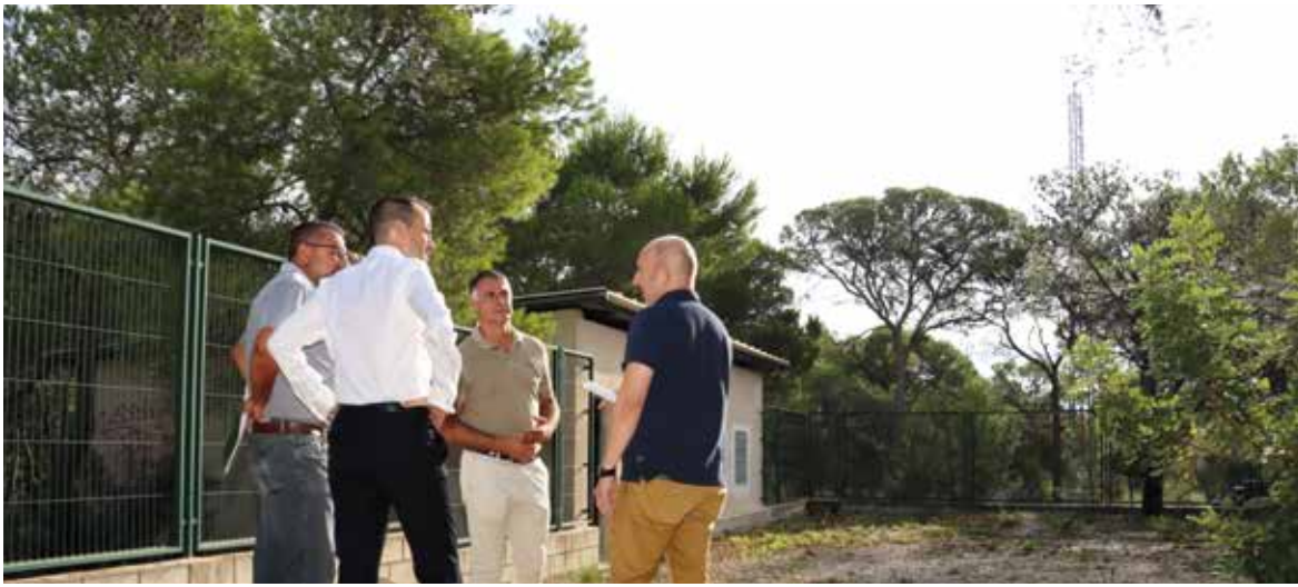
Visita al Vedat