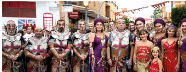
Moros i Cristians

Sant Jaume. I xiquets i majors van tindre els seus moments, com és el cas dels més majors.. Els esdeveniments esportius també han tingut els seus moments amb partides de pilota, exhibicions de karate, billar, truc, escacs o futbol. No podem deixar a banda a la Reina i a les seues Dames que han assistit i gaudit de tots i cadascun dels actes.