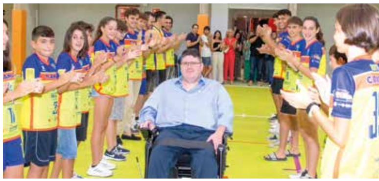
Homenaje a Vicent Palau Arnau