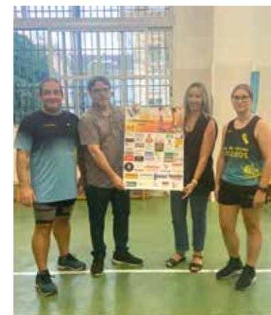
Presentación de la temporada

Las personas interesadas ya pueden inscribirse a la prueba a través de la página web: cronorunner.com .