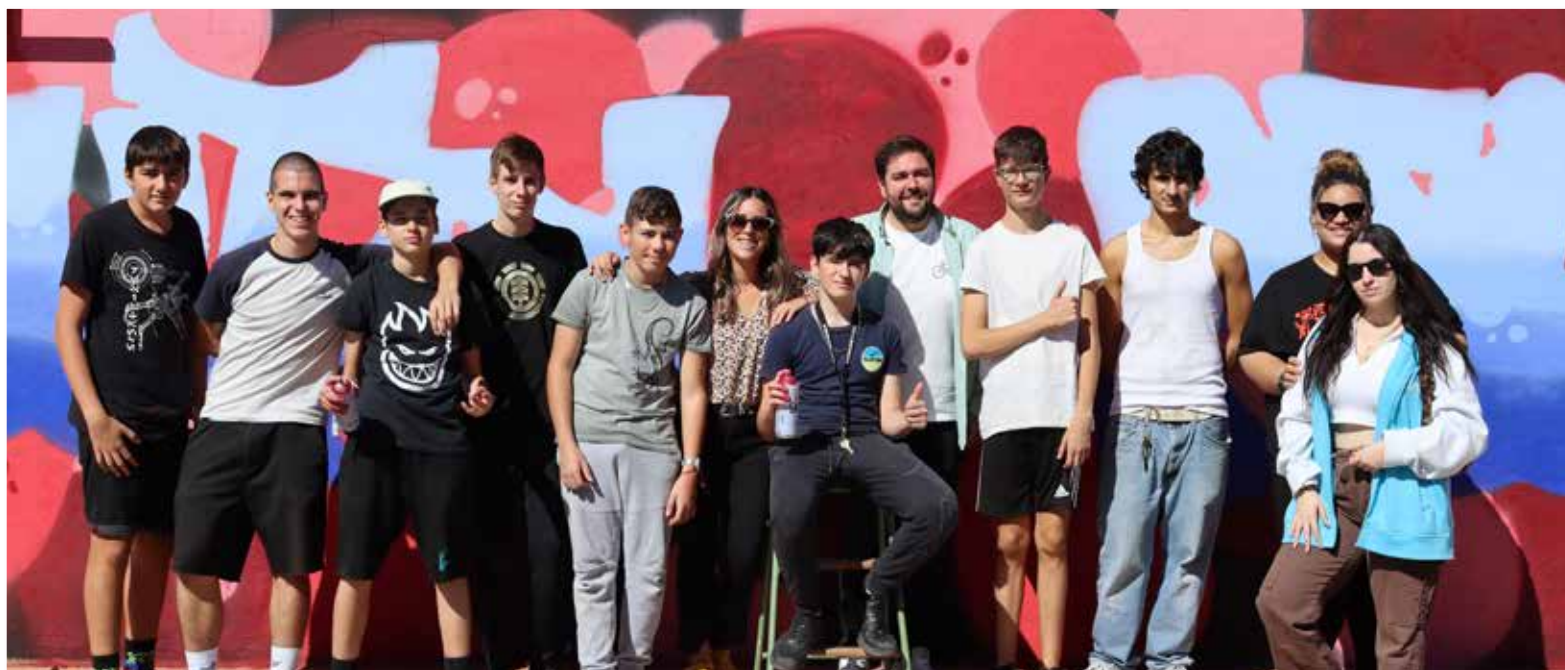
Imatge del passat any, projecte SAY (Street Art Young)