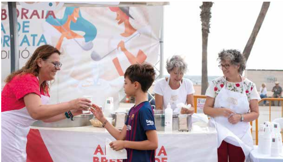
Reparto de la horchata en La Patacona