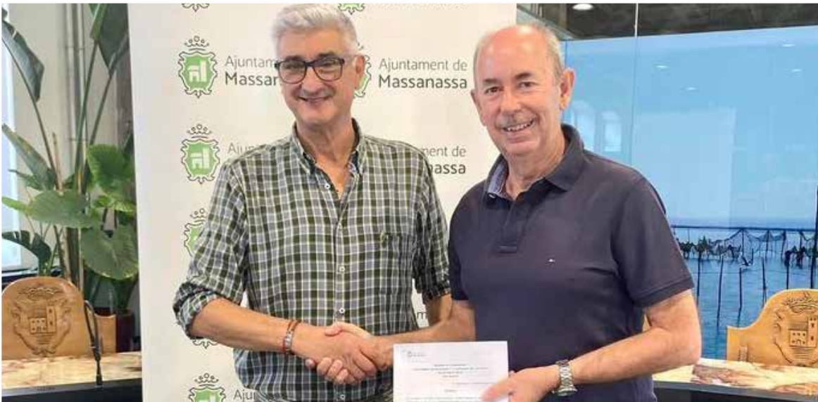
Signatura del conveni de l'alcalde de Massanassa i el president de l'associació