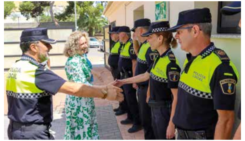
La alcaldesa junto a policías locales