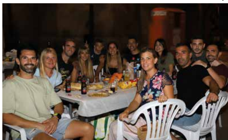
Nit de l'Embotit