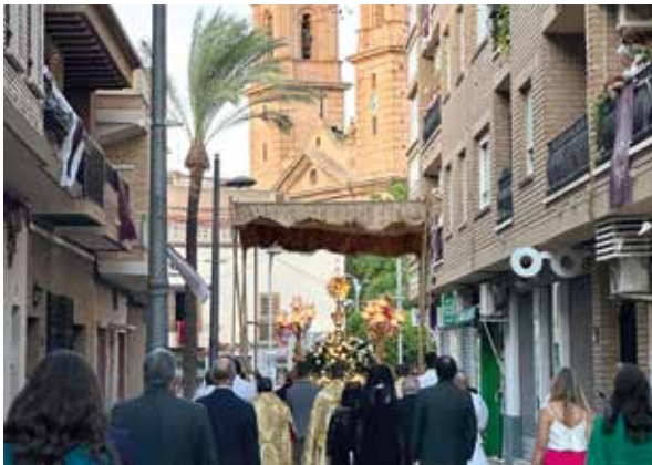
Procesión del Corpus