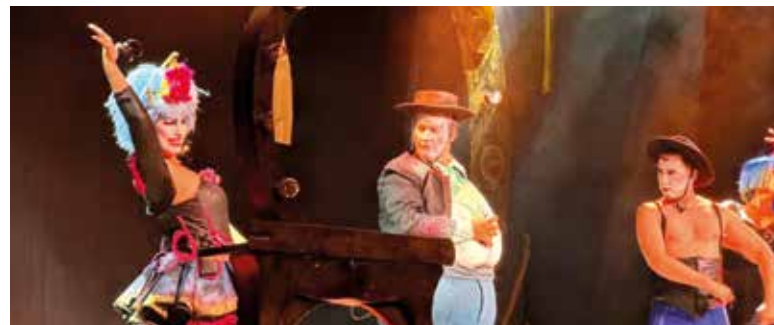
The Opera Locos

nit de disfresses. A més, van tindre lloc nombroses activitats per als més xicotets.