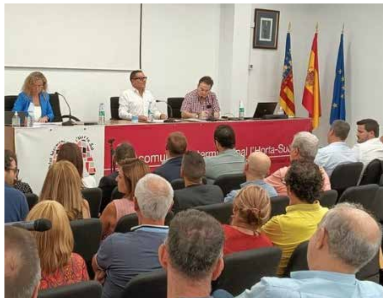
Pleno de constitución de la Mancomunitat de l'Horta Sud