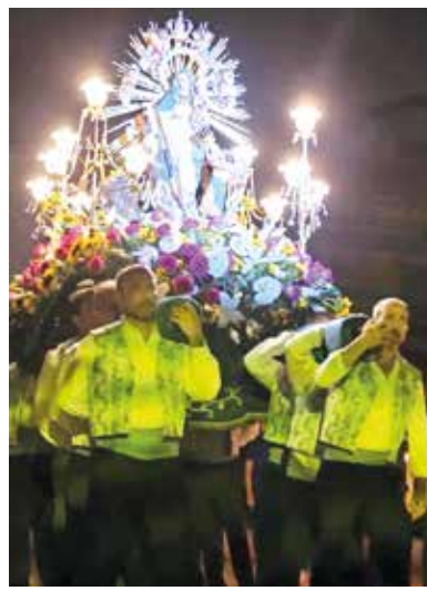
Clavaria Verge de la Llum