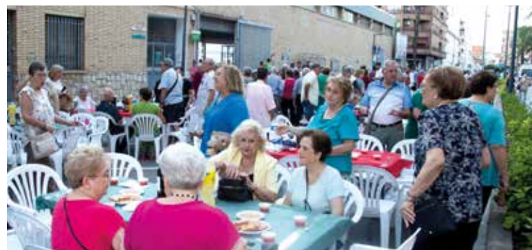
Berenar dels Majors