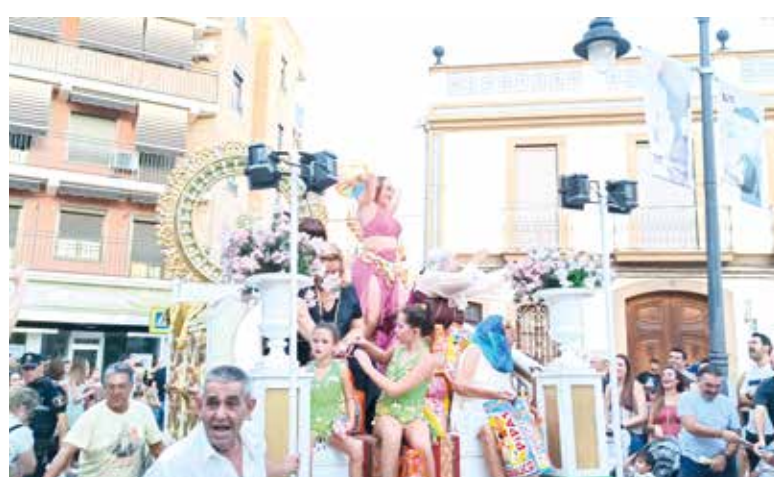
Cabalgata de las Clavariesas Virgen de la Buena Muerte