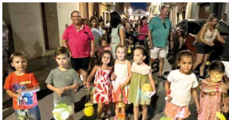
Nit dels farolets