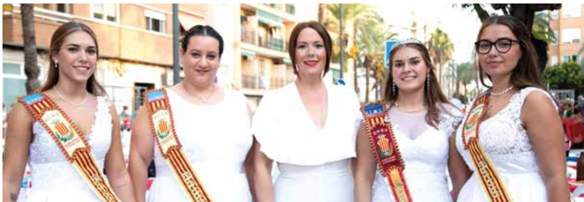
L'alcaldeessa, amb la reina i dames