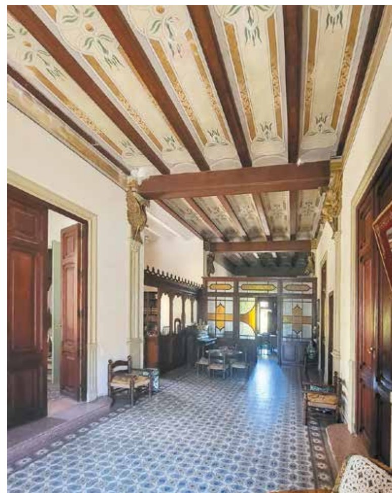
Casa dels Artillers de Foios