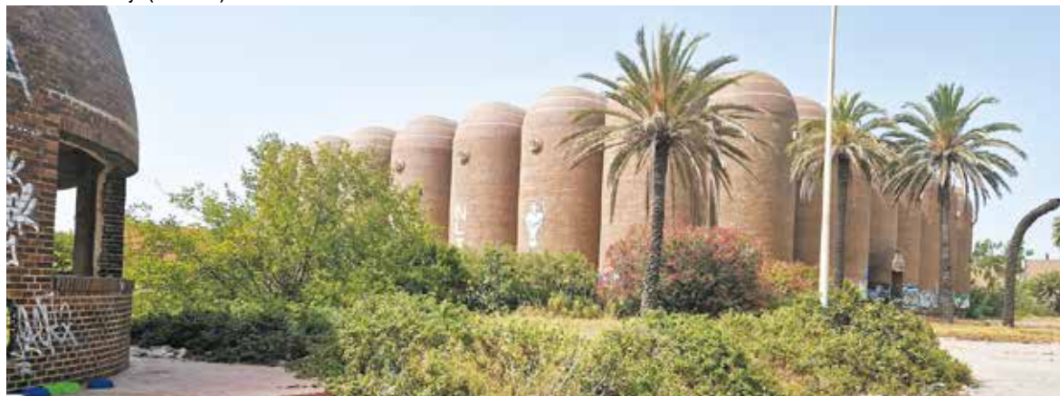
Vinaval en Alboraya (Patacona)

La recuperación del patrimonio, también el industrial, es sin duda un claro ejemplo de sostenibilidad, de protección del entorno y también de su historia.