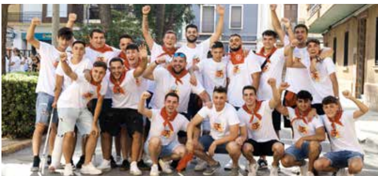
Festers de Sant Francesc de La Pobla de Farnals.