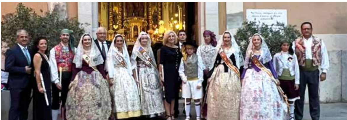
Procesión Mare de Déu de la Misericòrdia