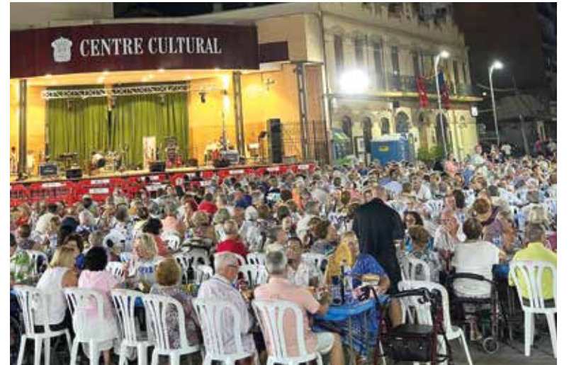
Los mayores disfrutan de una velada para ellos