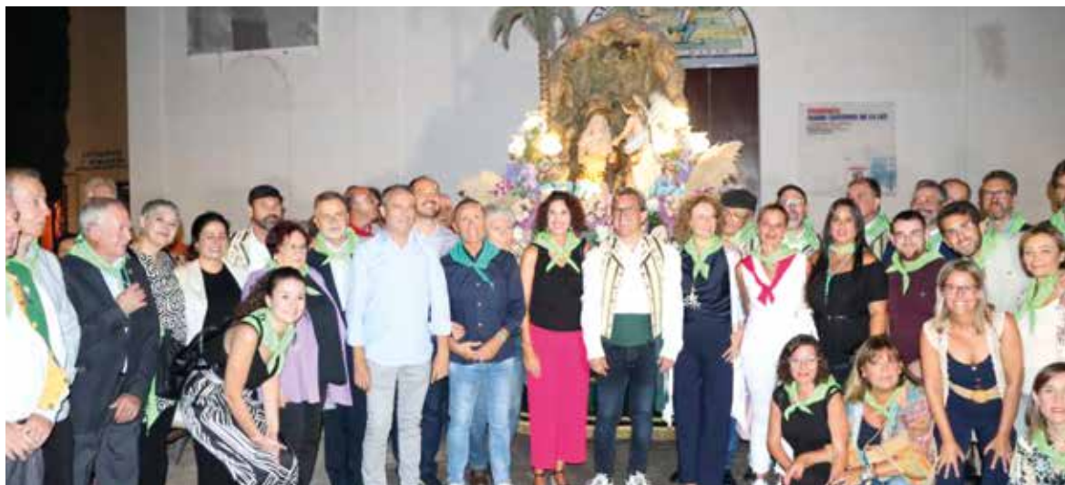
Clavaria San Onofre