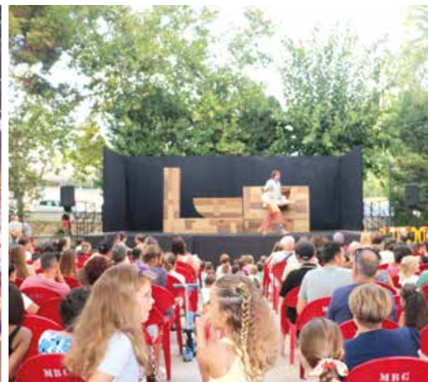
Actuaciones para todas las edades