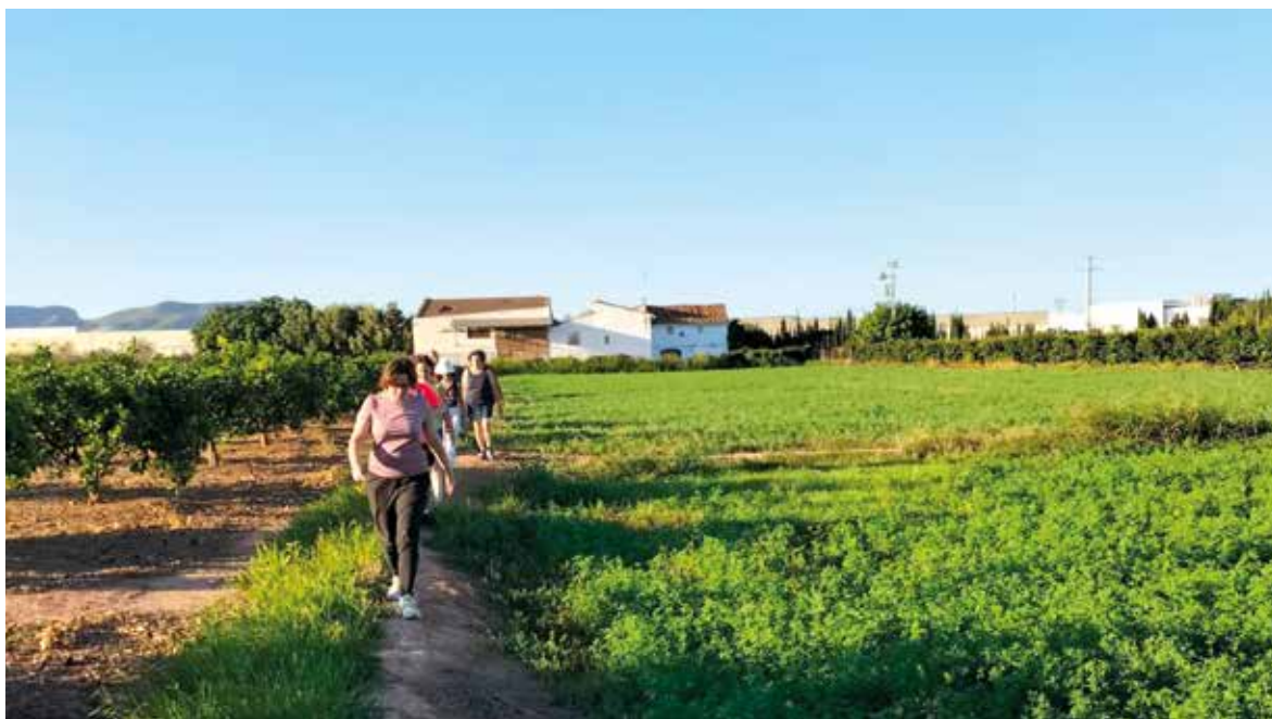
Paseos por el campo

La comitiva encapçalada per l'alcalde de Cumbres Mayores ha arribat sobre les 13.00 hores a la plaça de Sant Vicent Ferrer de la localitat valenciana envoltats per veïns, veïnes i familiars que els esperaven amb molta il·lusió.