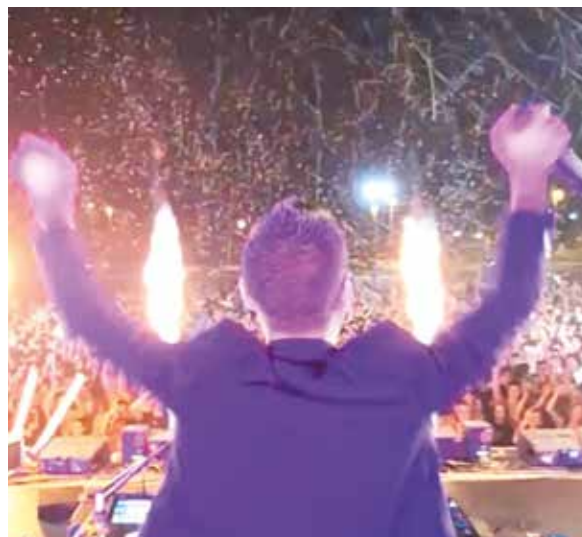
Miles de personas disfrutaron de Tallarina on tour