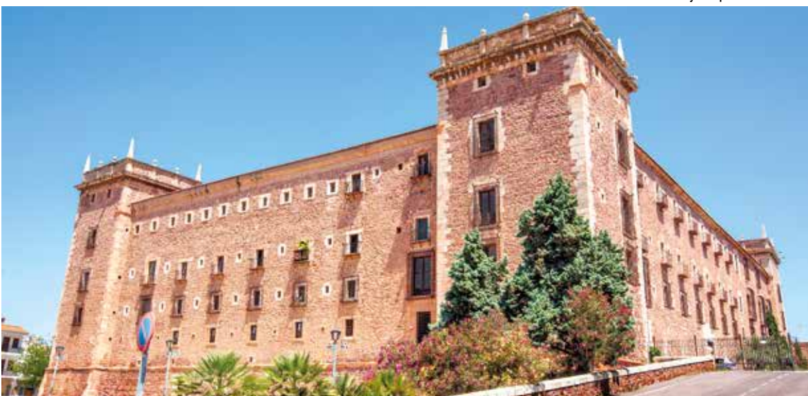
Monasterio de El Puig