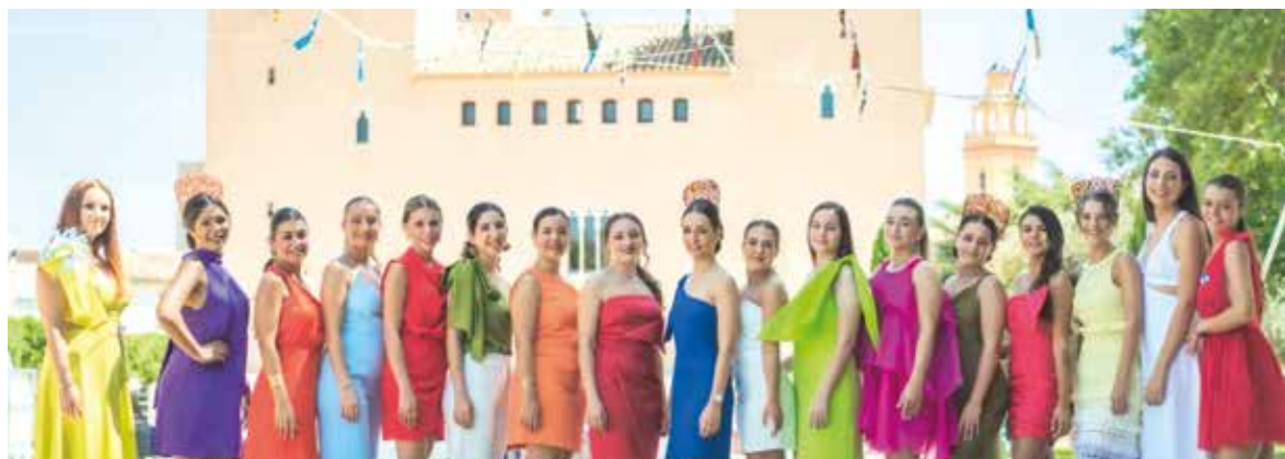
Filles de Maria Albalat dels Sorells