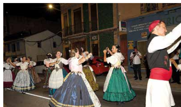
Grup de dases en La Passà

El regidor de Festes, Sergio Climent, va agrair a la població "la seua implicació en aquestes festes i la seua contribució al fet que hagen sigut un èxit".