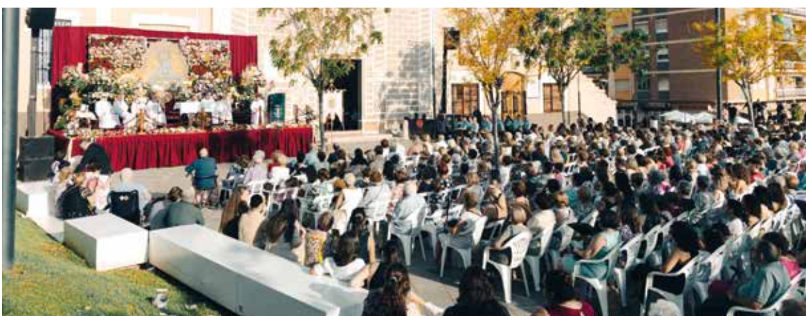
Missa en honor a la Mare de Déu de Vallivana