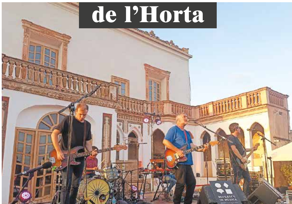
Palauet de Nolla en Meliana