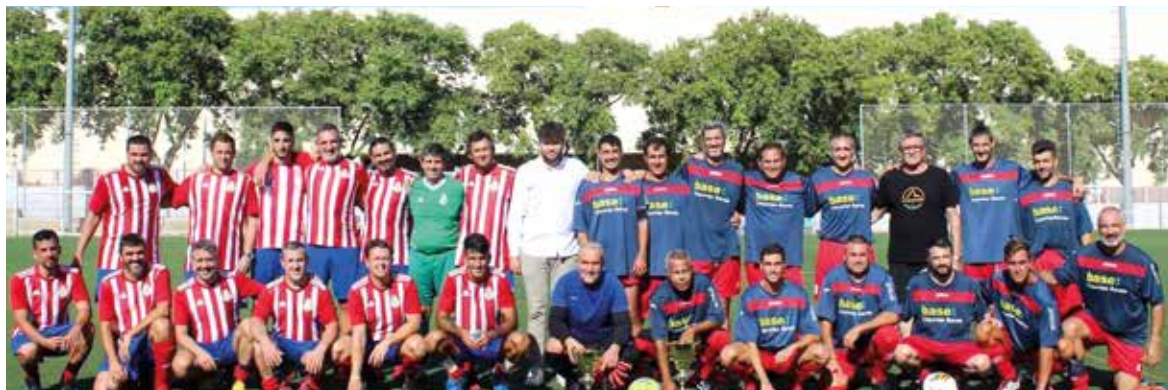
Trofeu veterans Festes de Moncada