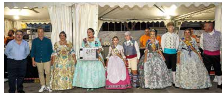
Inauguració del recinte firal