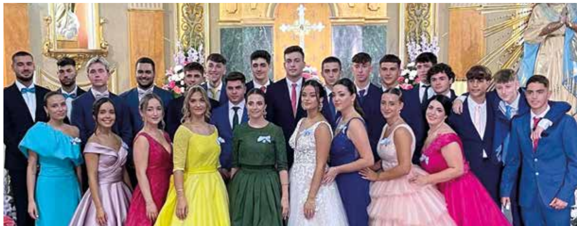
Festa de les Filles de Maria