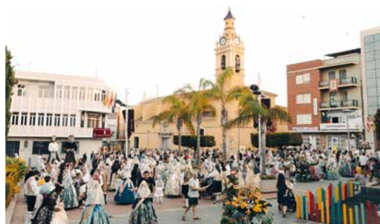
Ofrena de Flors a la Mare de Déu de Vallivana