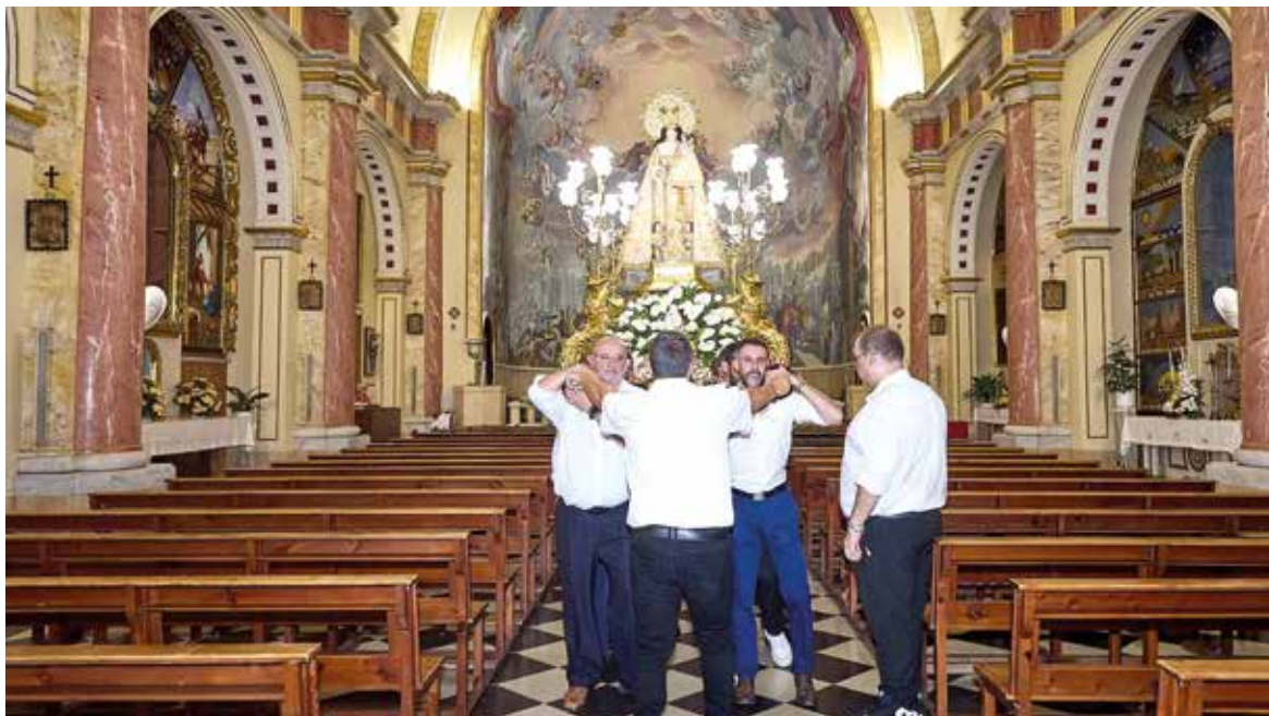
Processó de la Mare de Déu