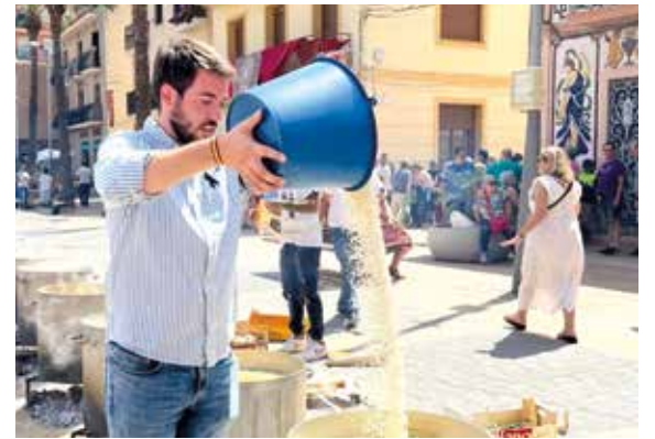
Día de las tradicionales calderas