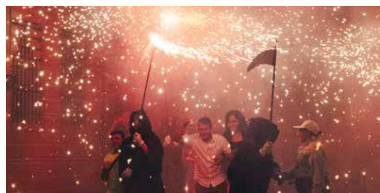
Correfocs dels Dimonis de la Dalla