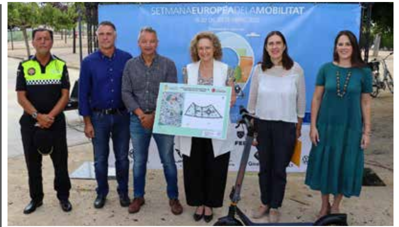
Durante la rueda de prensa

La programación continuará el miércoles a las 10h con la charla ‘Humaniza tu ciudad’, que ofrecerá a la ciudadanía una intensa velada sobre la ciudad del futuro en la sala cívica de l’Antic Mercat, como antesala de la jornada de puertas abiertas que tendrá lugar l’Espai de Solidaritat Parreño del Barrio del Xenillet a las 18h. Y, como colofón, la prestigiosa Feria de Movilidad Sostenible cerrará esta edición de la Semana de la Movilidad de Torrent los días 21 y 22, brindado a la ciudadanía otra gran exhibición de vehículos eléctricos en la Av. del Vedat, en la que no faltarán grandes marcas como Tesla o Mercedes.