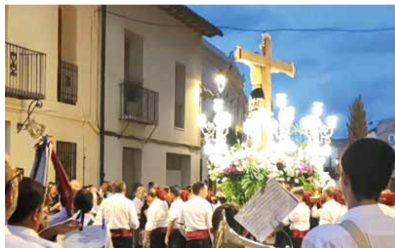
Processó del Santíssim Crist de les Ànimes