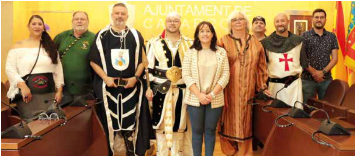
Membres de la Junta Directiva i càrrecs festers d'Intercomparsa, junt a representants de les capitaniaes mora i cristiana i de distintes filaes