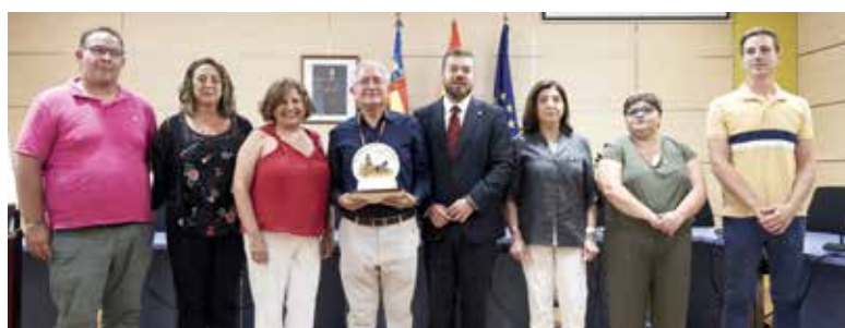
Entrega del guardó

Por otro lado el resto de actividades también han crecido en número de asistentes, sobre todo las actividades deportivas al aire libre en la zona de playa, como la gimnasia y el yoga en la arena, o como el baile, que han hecho que este verano en La Pobla de Farnals el deporte sea también un punto de encuentro para la diversión y el ejercicio.