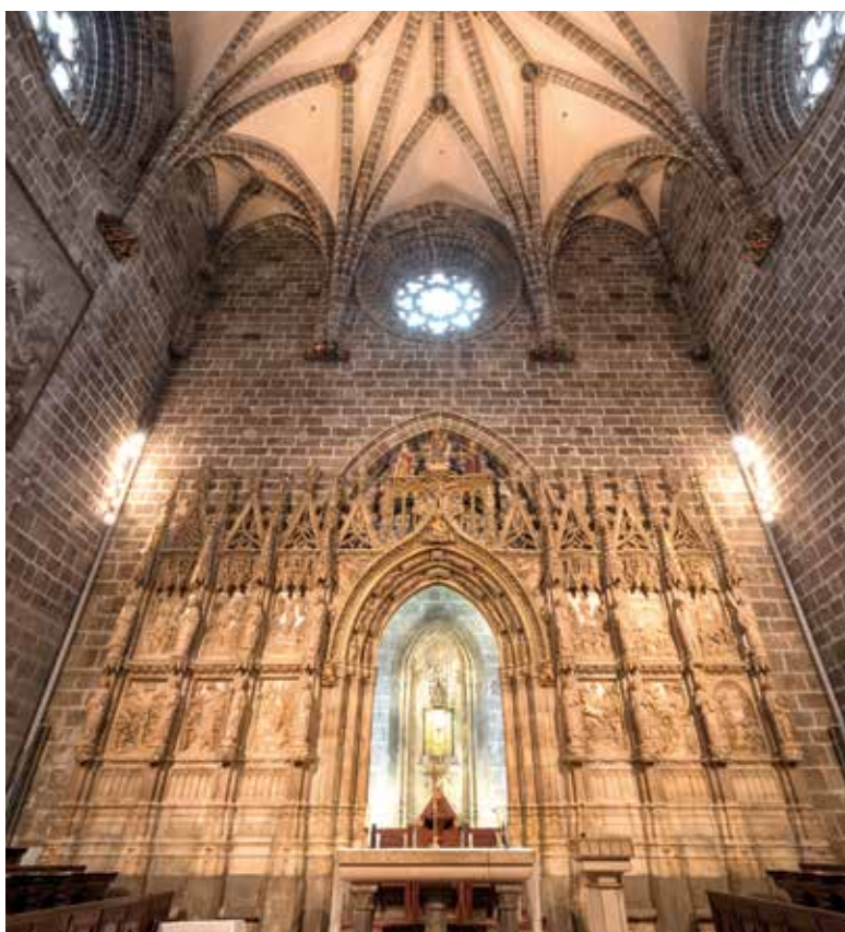
Catedral de Valencia