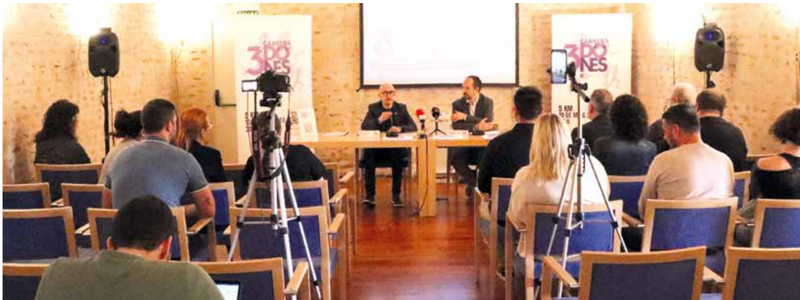
Els alcaldes van oferir una roda de premsa