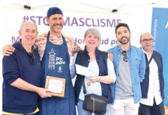
Premios del Concurso de Perol