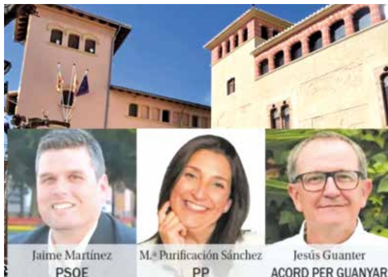
Alcalde al costat dels portaveus de l'oposició