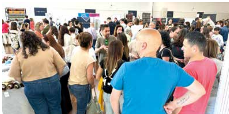
Miles de personas pasaron por Torrent durante el fin de semana

Toda una serie de empresas torrentinas, así como agremiadas de renombre en la Comunitat Valenciana han estado participado en este evento: Trajes regionales Amparo Gálvez, Blusones Cocoliso, Empar del Remei, A l'Antiga, Andrea Indumentaria, L'Ú i Dos Indumentària Valenciana, El Vestidor Faller, Artesanía Fidela, Alan Indumentaria, Carlos Salvador Indumentaria, Arturo Torremocha,