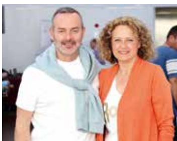
También se celebraron diferentes charlas. La alcaldesa de la población también acudió a los actos

Indumentaristes La Clau, Nicolina Mercería Técnica, Marian Roba Valenciana i Festa, El Tabalet, 25 Alfileres y SC Indumentaria. Junto a la zona comercial, el I Showroom Fallero ha ofrecido un