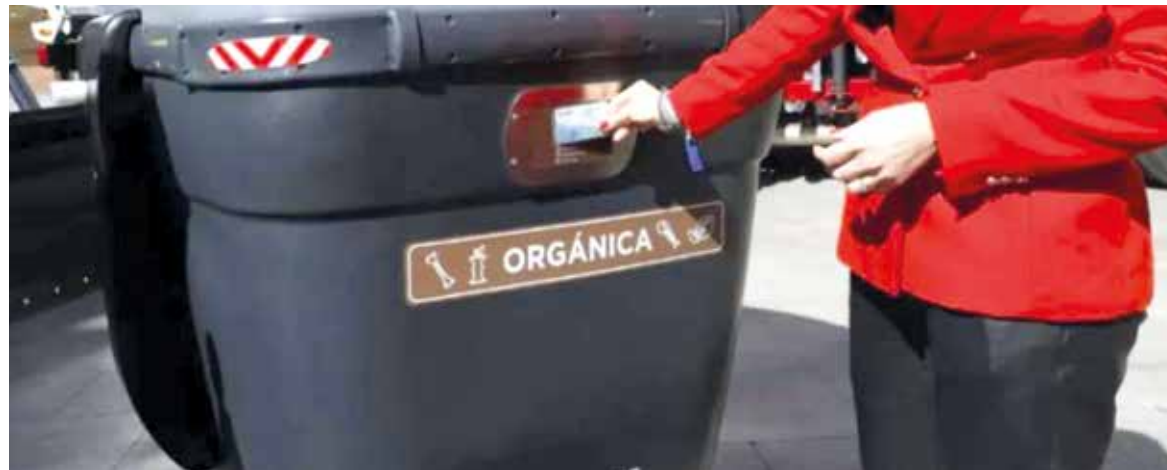
Contenidors intel·ligents situats ja a Saragossa

El nou contracte de neteja implica el canvi de tots els contenidors, més de 2.000, pels nous contenidors intel·ligents i de major capacitat. A més, també es renova