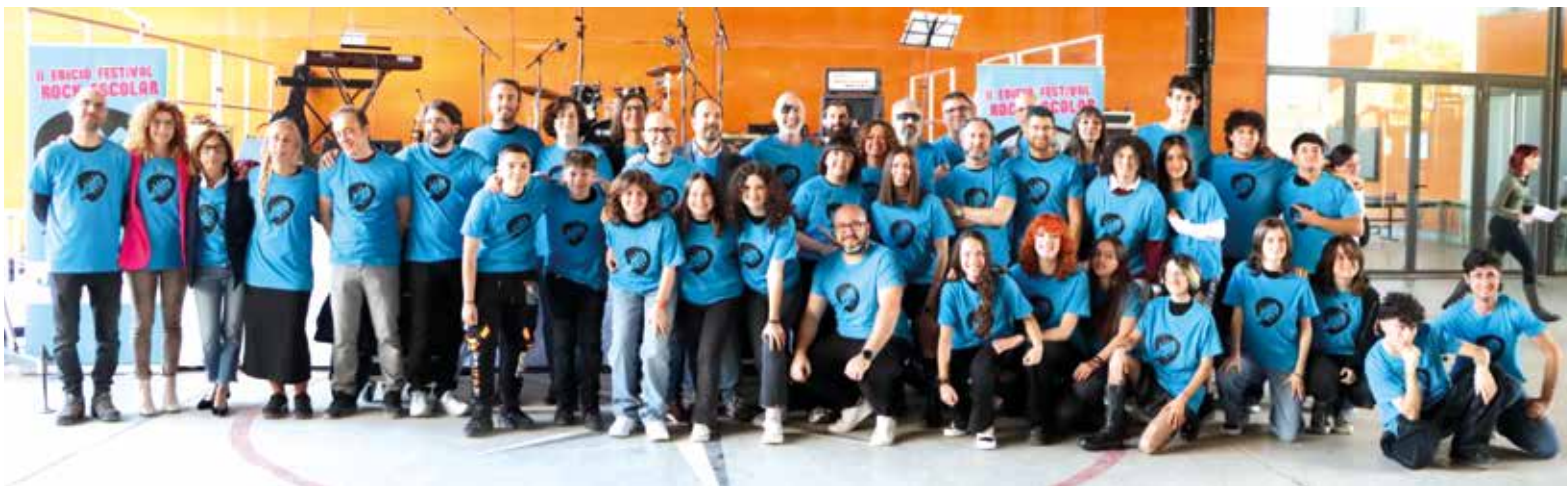
Professorat i alumnat.