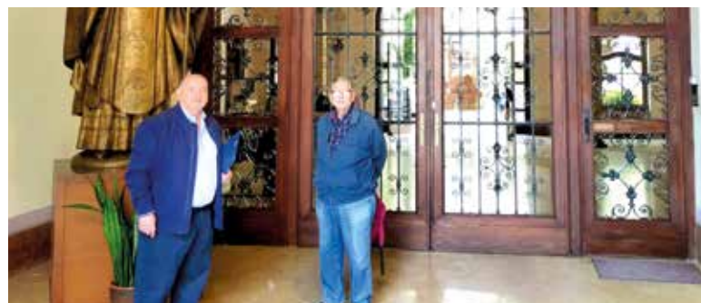
El presidente y el secretario, al salir del Palacio Arzobispal de presentar los estatutos de la cofradía