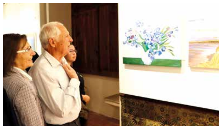
Imatge d'algunes de les obres