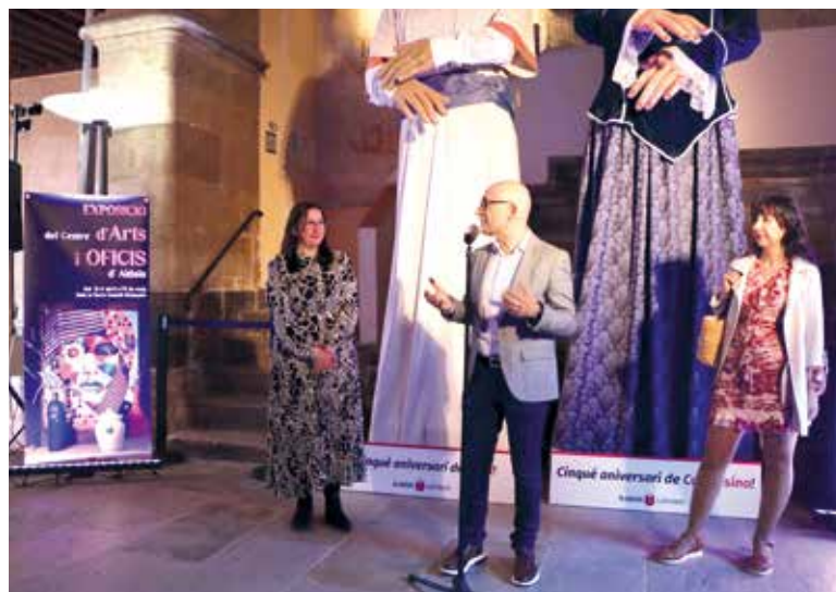
Alcalde d'Alaquàs durant la inauguració

La mostra és un conjunt aleatori d'obres en les quals cada persona ha plasmat una idea del que en eixe moment li abellia o necessitava pintar. Com a resultat, gaudim d'una exposició rica en temàtica, variada i molt interessant.