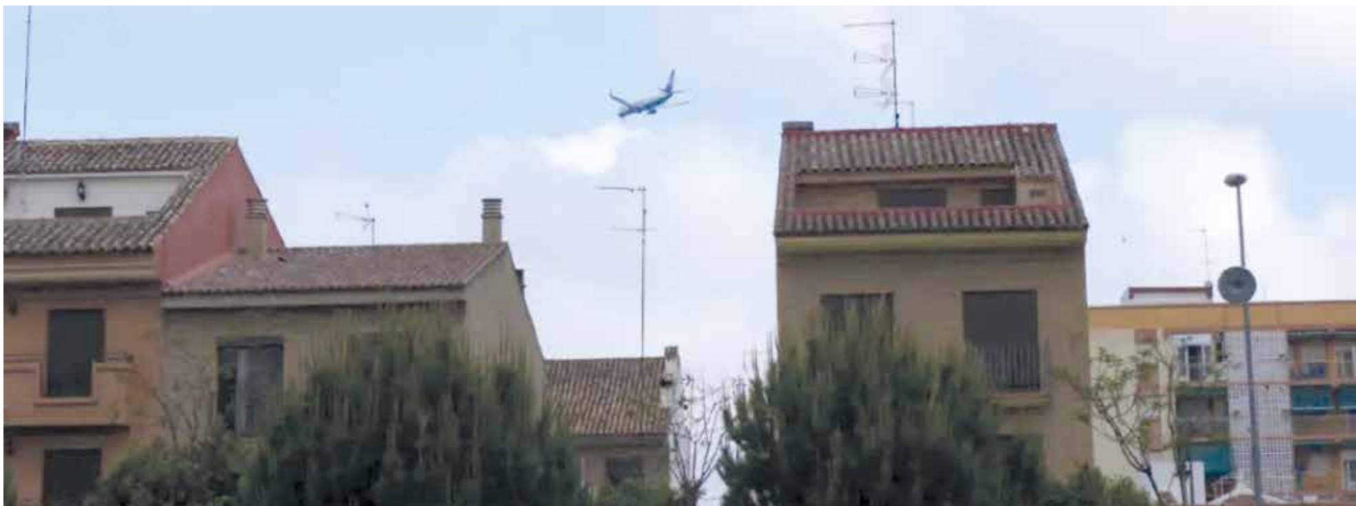
Un avió sobrevolant habitatges de Xirivella