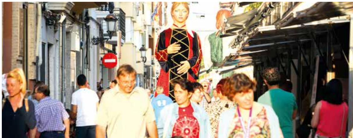
Imagen de la feria del año pasado