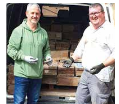
Alcaldessa, regidor i brigada de obres ja amb les peces donades a Meliana