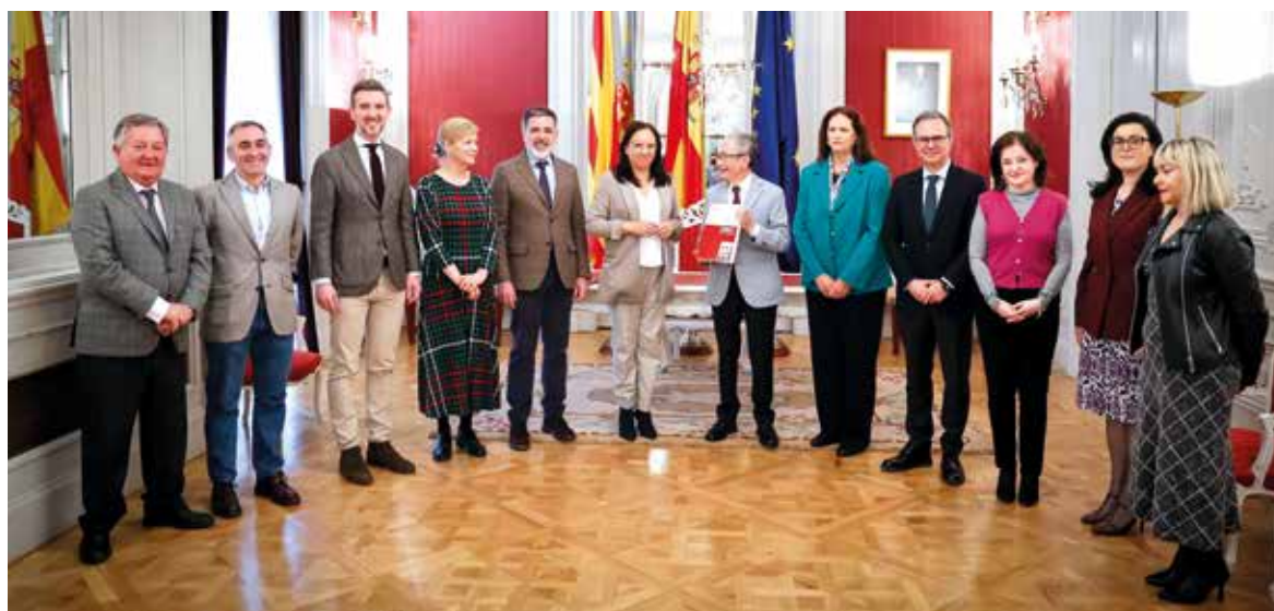
Asistentes a la presentación del Informe Anual del Síndic de Greuges 2023

“LAS LIMITACIONES DEL ACCESO A LA INFORMACIÓN POR LOS CONCEJALES DE LA OPOSICIÓN SE HAN AMPLIADO A PARTIR DE LAS ELECCIONES LOCALES DE 2023”