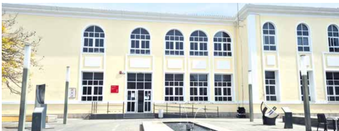
Centro de Salud de Albuixech