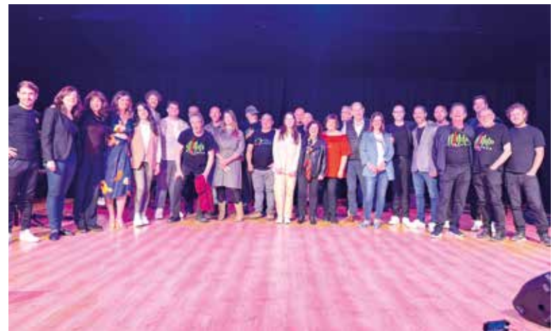
Concierto benéfico a favor de la Federación Española de Parkinson

Según explicó la concejala de cultura, "desde el Ayuntamiento estamos impulsando diferentes actos culturales para todos los públicos" y avanzó que este año volverá a haber 'Juliol Musical' con numerosas actuaciones previstas.