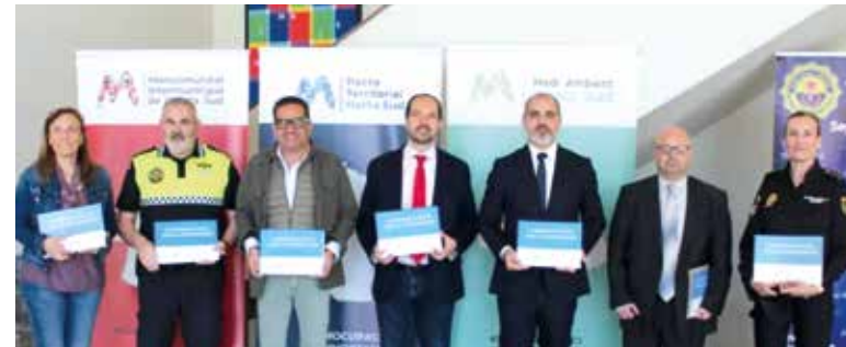
La jornada va comptar amb l'assistència d'autoritats