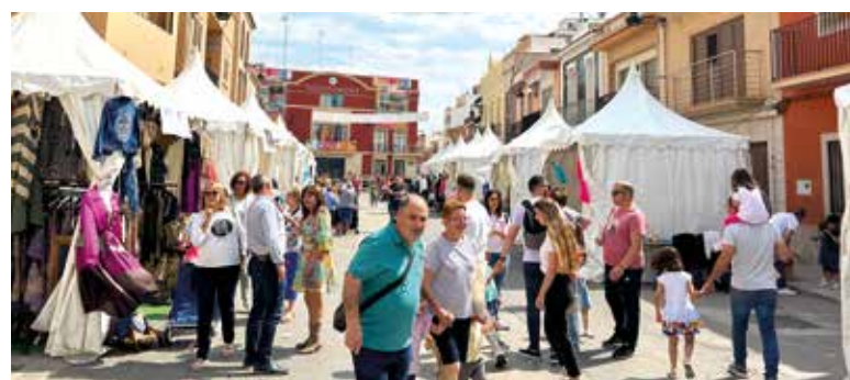
Fira a Rafelbunyol l'any passat

"Fomentar el comerç de proximitat és una de les nostres prioritats. Volem animar a tots els nostres comerços a participar activament en aquesta cita, ja que la varietat, la qualitat i el servei destaquen tant