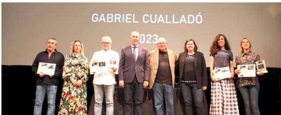
1 Concurso Nacional de Fotografía Gabriel Cualladó