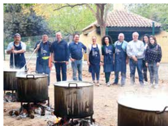
2º Día del Perol de Massanassa