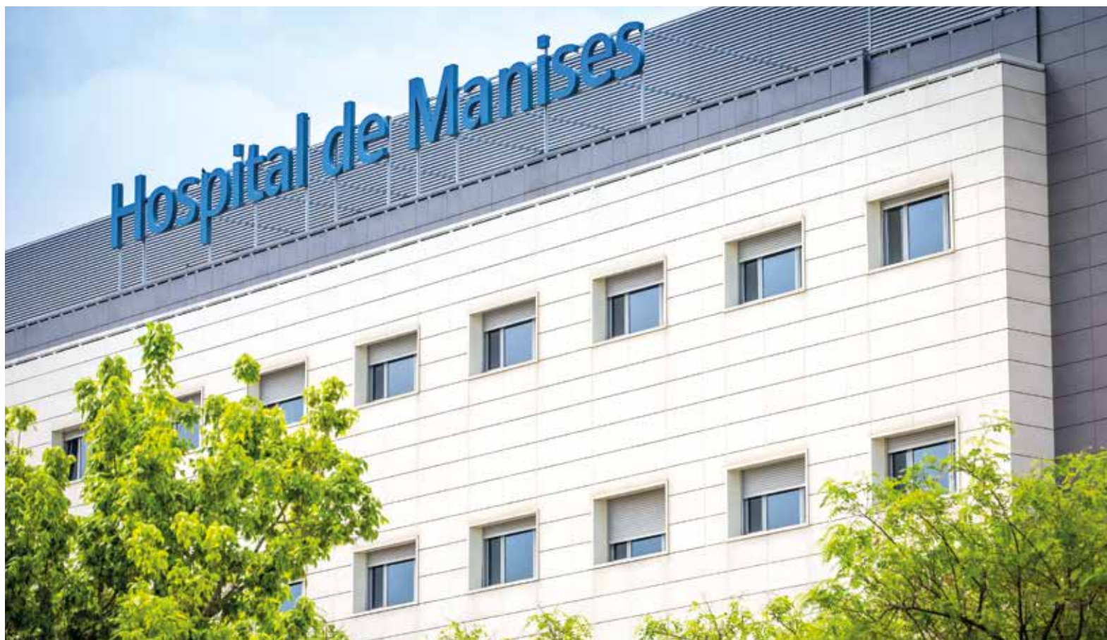
Hospital de Manises