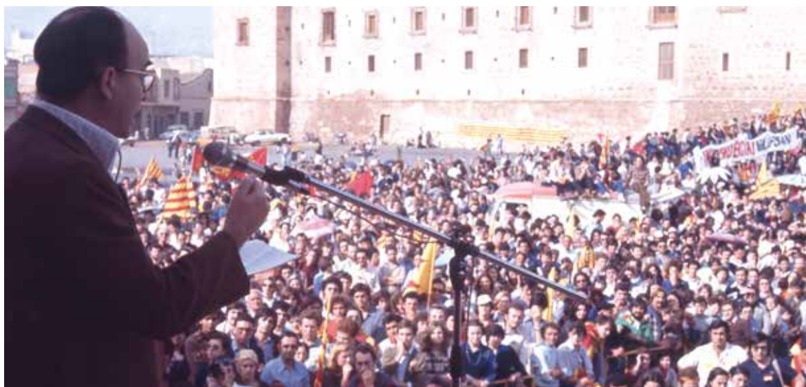
Intervenció de Vicent Andrés Estellés en l'Aplec del Puig de 1977