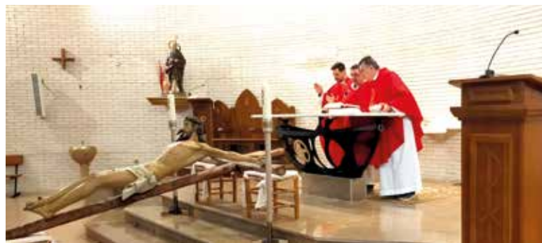
Imagen de Semana Santa con el Cristo que preside el Altar Mayor de la Iglesia de la playa

Entre los fines de la cofradía, entre otros, indica el secretario son "fomentar acciones solidarias y caritativas, así como favorecer las obras de caridad, no sólo entre sus miembros, sino sobre todo con los enfermos y los más necesitados"