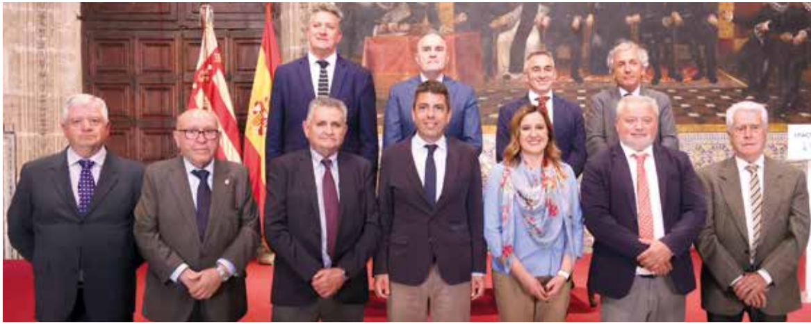
Firmants del Pacte de l'Aigua per l'Albufera