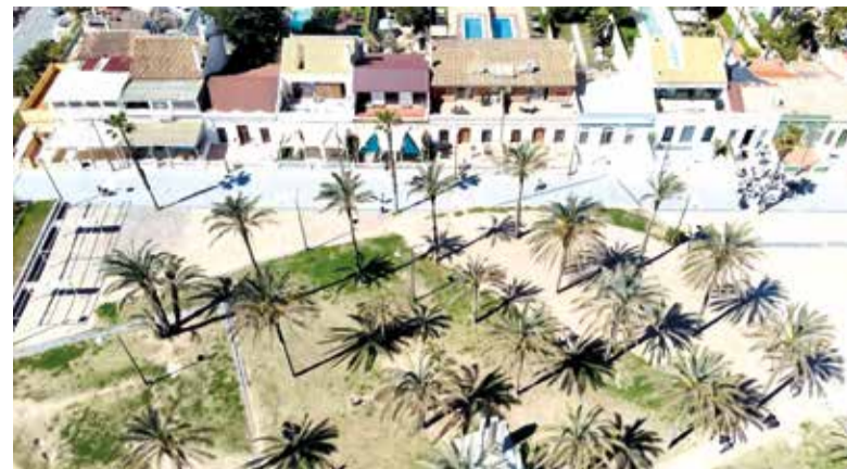
Palmerar de La Patacona

I és que al llarg de mig segle, la Junta ha sigut clau en la coordinació i organització dels actes processionals, gràcies a l'esforç conjunt de les deu germandats que la componen. Tant és així que en 2018 va ser declarada com a Festa d'Interés Turístic Provincial en un projecte conjunt amb l'Ajuntament.