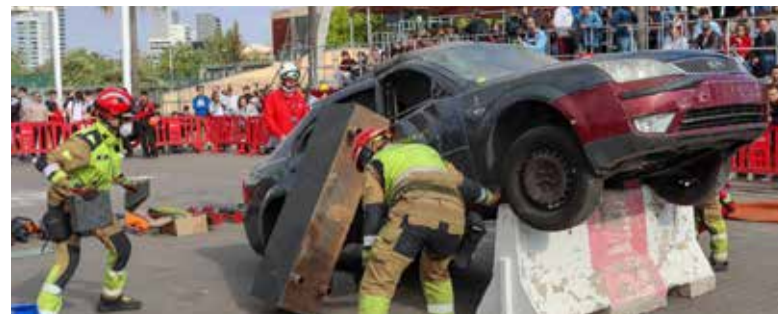
Recreació d'una actuació dels bombers

Tampoc va escapar de la destrucció total un dels escenaris més icònics de les representacions sacres de la Vida, Passió, Mort i Resurrecció de Jesús, el pretori, estructura que s'alçava sobre la plaça de l'Ajuntament per a acollir escenes clau com el lliurament del profeta als romans o el juí de Pilat. Sense estes localitzacions, de creació artesanal i la pèrdua de la qual està valorada en uns 35.000 euros, l'equip actoral i tècnic de l'Agrupació Cultural La Passió ha treballat sense descans per a tornar a representar totes les escenes, oferint una proposta escènica alternativa que segur emocionarà al públic.