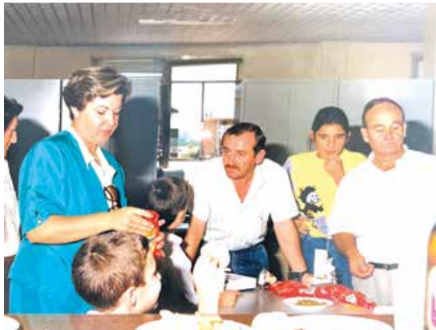
Tribuna municipal en els anys 90, en una celebració

replica, "tot va ser molt progressiu. Saps que el servici de recollida d'escombraries era molt diferent? No existia el plàstic, i el vidre no es rebutjava, els envasos buits es retornaven a les botigues. Eren uns altres temps".