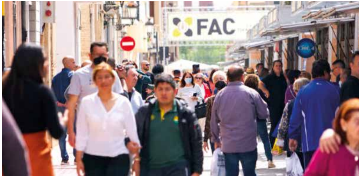
Milers de persones visiten la FAC, imatge de l'any passat

sociativa i Comercial serà un cant a l'optimisme i una oportunitat d'ajudar a les persones que estan alçant-se i plantant-li cara a l'adversitat.