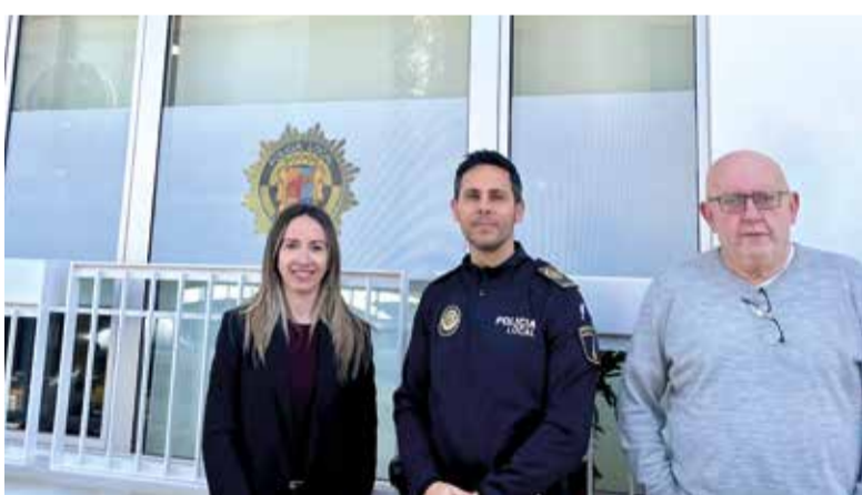
Alcalde de Museros, regidor i cap de Policia en les noves oficines