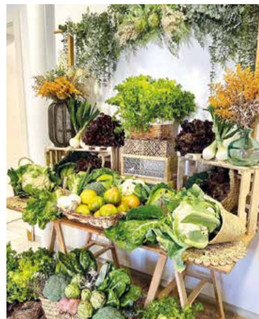
Els productes de l'horta de Meliana són els protagonistes en la presentació dels actes.