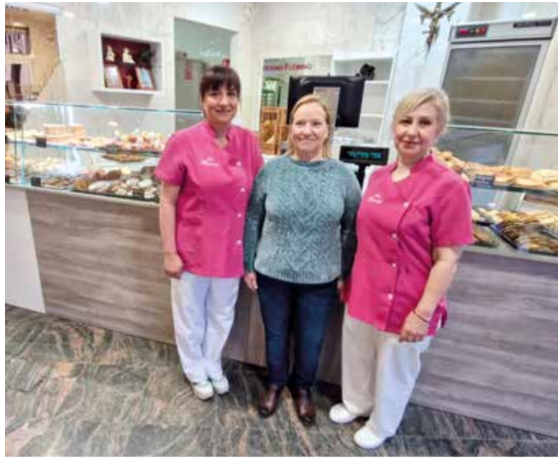
Forn pastisseria Fleming a Aldaia