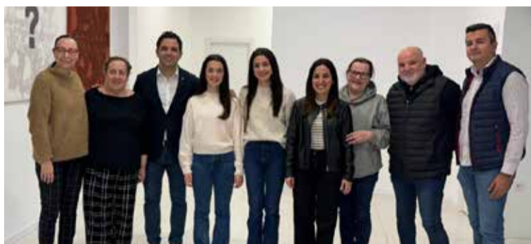
Sagredo amb la Presidenta de JLF i els membres de la comissió del Museu Faller

Amb este projecte, l'Ajuntament de Paterna fa un pas més en la seua aposta per la conservació i promoció de les seues tradicions.