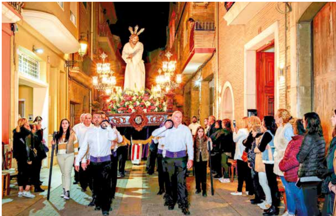
Processó a Alboraya