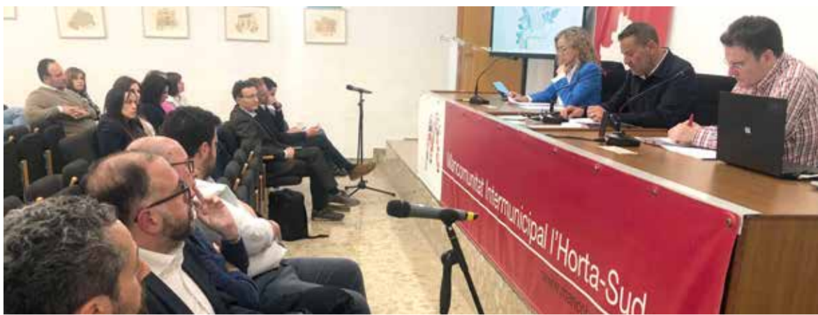
Ple de la Mancomunitat de l'Horta Sud