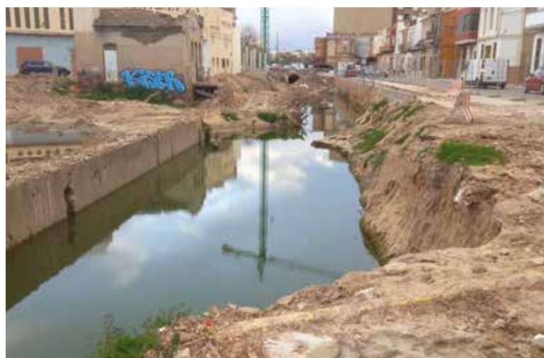
Imatge recent del tram descobert del barranc de la Rambleta existent entre Catarroja i Albal.