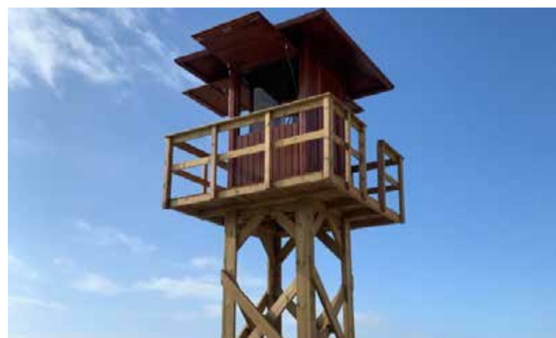
Noves torres de vigilància