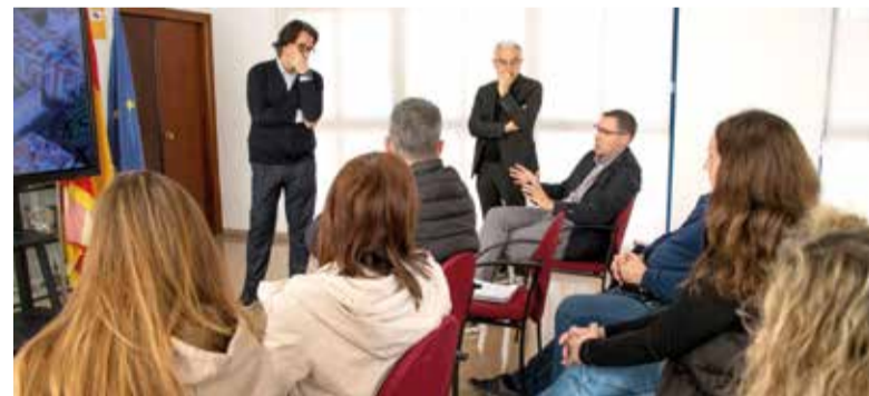
Presentació del projecte

Entre altres elements destacats, el futur edifici comptarà amb mesures específiques de protecció enfront d'inundacions, pistes esportives i gimnàs situats en la primera planta, així com criteris de sostenibilitat, eficiència, energètica i autosuficiència. Tot això