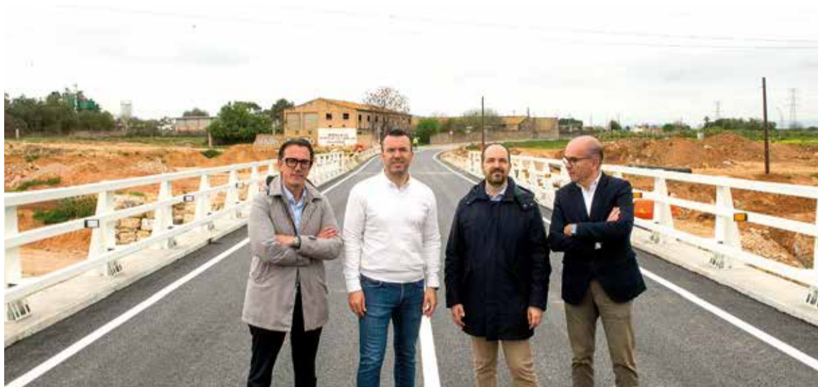
El president de la Diputació, junt l'alcalde d'Aldaia i tècnics