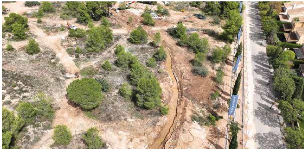
Situació actual de la zona

origen en la defensa del patrimoni d'aquesta zona de Godella.