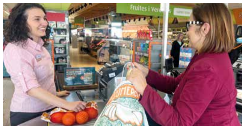
Repartiment de bosses en Consum

Els clients poden col·laborar des de hui mateix amb la iniciativa sol·licitant esta bossa, de paper i amb el lema 'El comerç ajuda al comerç', en passar per caixa i contribuir així a la volta a la normalitat dels més de 8.800 comerços afectats pel pas del temporal del passat 29 d'octubre. Tota la recaptació que s'aconsegueixca per la venda d'estes bosses anirà destinada íntegrament als comerços afectats per a promoure la seua activitat i reactivació comercial.