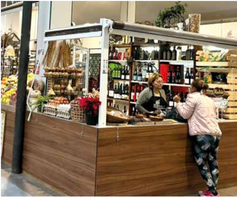
Mercat de Catarroja