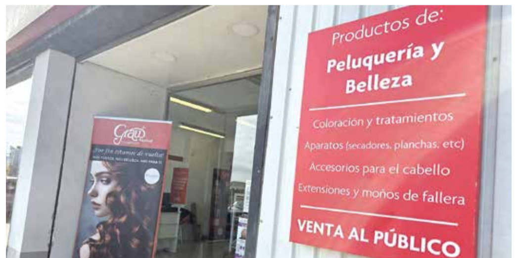
La venta no es sólo para profesionales, desde siempre venden al público.