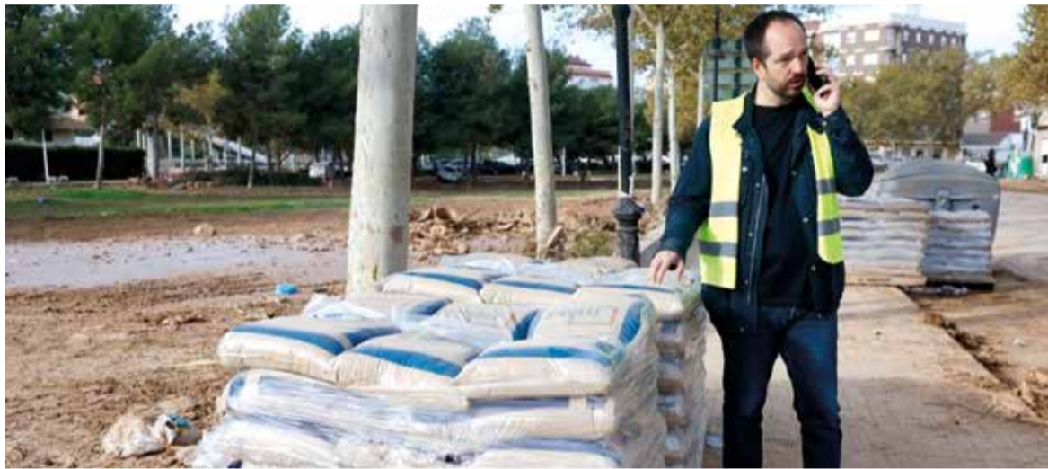
Imatge d'arxiu. L'alcalde, després de la Dana, i amb previsió de pluges, al costat del barranc, on es van posar sacs d'arena perquè les comportes estaven trencades

L'ANUNCI QUE VALÈNCIA CIUTAT REALITZARÀ AL·LEGACIONS AL DESVIAMENT DE LA SALETA HA CAUSAT UN PROFUND MALESTAR A ALDAIA, EL QUART MUNICIPI MÉS AFECTAT PER LA DANA I EN EL QUAL VAN MORIR SIS PERSONES