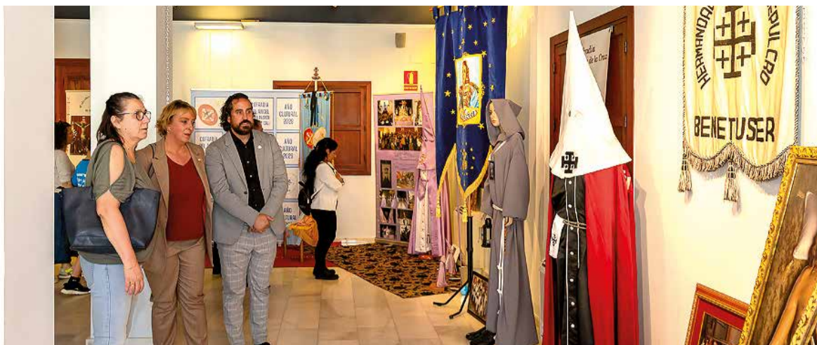
Inauguració de l'exposició de la Setmana Santa