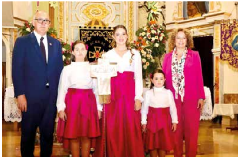
Pregó de la Setmana Santa a Torrent