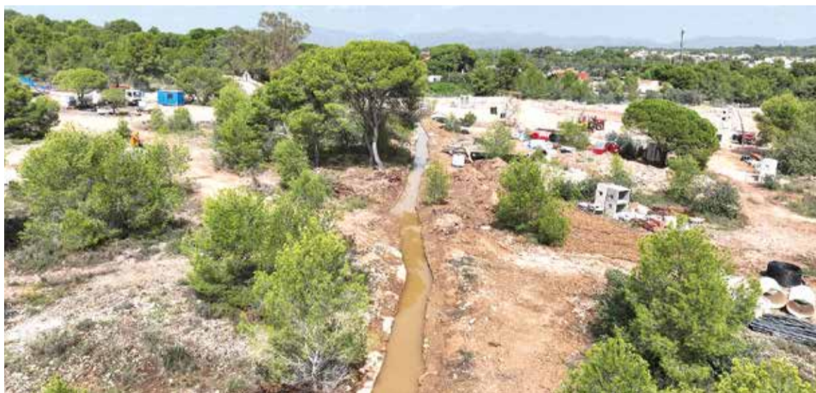
PAI de la Torre del Pirata

en aquesta àrea, les plataformes Salvem La Torre del Pirata Pulmó Verd de Godella i Natura Godella van sol·licitar a l'Ajuntament "la paralització immediata de les obres fins que hi hagués un estudi rigorós". El PAI que inclou la construcció de 447 habitatges va ser aprovat al 2002, al 2008 es van paralitzar les obres i la promotora va reprendre el projecte després