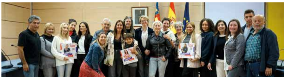
Presentació del curtmetratge a l'Ajuntament de La Pobla de Farnals