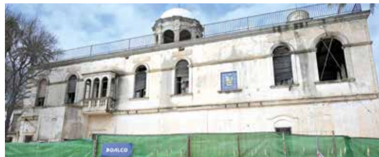
Vila Amparo a Paiporta