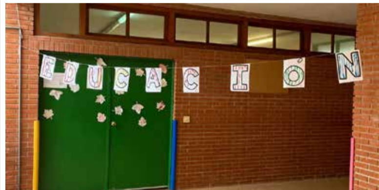
Escoleta de La Pobla de Farnals

La documentació completa de la licitació, així com els requisits tècnics i administratius, està disponible en el perfil del contractant de l'Ajuntament en aquesta mateixa plataforma.