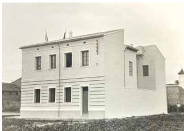
Ajuntament de La Pobla de Farnals en els anys 70