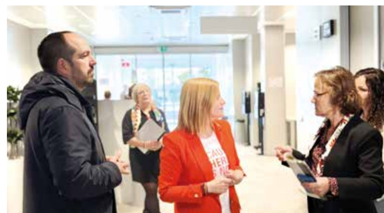
La delegada del Govern va visitar la població