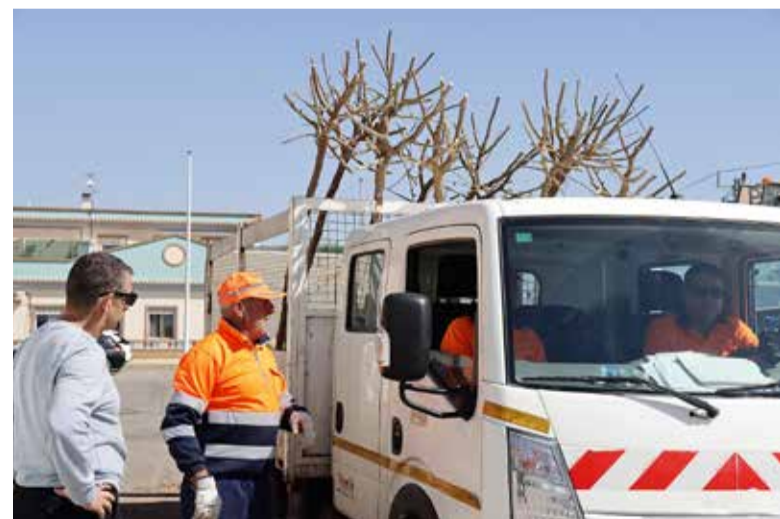
La brigada va ser l'encarregada de fer la plantació

tat, destaquen les moreres sense fruits, els tarongers bords i els aurons, totes elles espècies mediterrànies. A més, la brigada ha procurat substituir els que estaven malalts i cobrir els buits que havien quedat en diferents zones del nucli urbà.