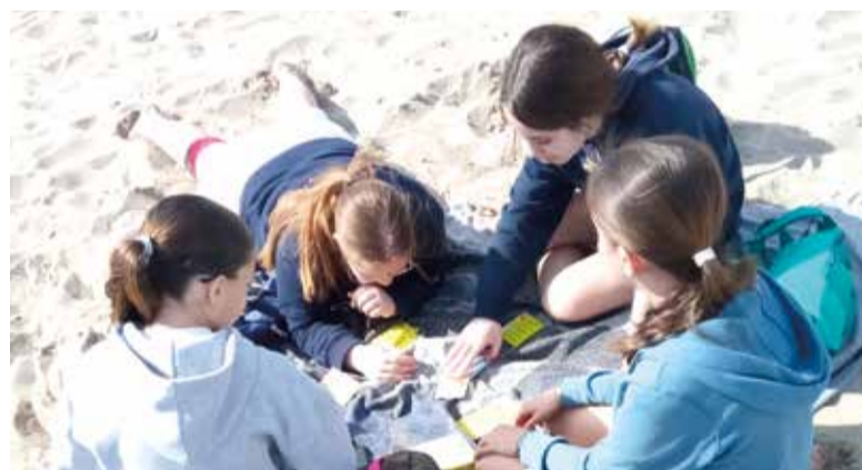
Activitats en la platja

Juventut de l'Ajuntament de la Pobla de Farnals ha organitzat una nova edició de Pasqua Jove, una proposta dirigida a joves d'entre 12 i 16 anys que tindrà lloc del 22 al 25 d'abril a l'Espai Jove, en horari de 10.00 a 13.00 hores.