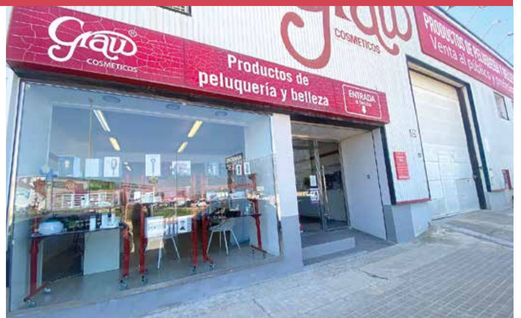
La tienda está completamente reformada. Está ubicada en la Calle Camí Fus, 64, polígono de Massanassa.