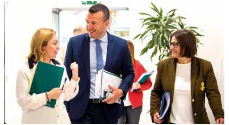
President i diputades de la Diputació de València